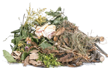
Recortes de césped y recortes de plantas