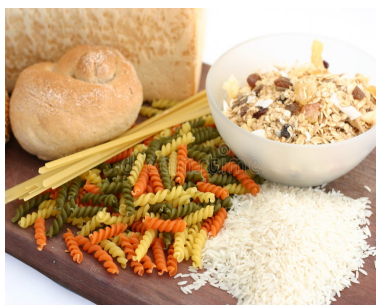
Pasta y Pan Arroz y Granos