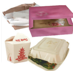
Papel manchado de alimentos